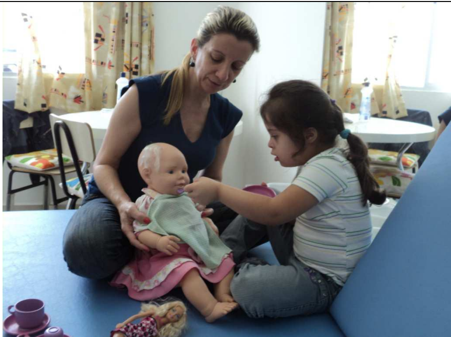
Atendimento de Fonoaudiologia

Psicologia: O serviço oferece a orientação e o apoio psicológico aos alunos, familiares e profissionais, assim como, contribui para ao processo de inclusão social, educacional e profissional da pessoa com deficiência intelectual.